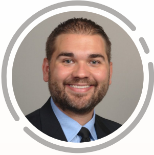
맷 랜드리 목사 제1대 UMC 담임목사 사우스 밴드 (인디애나주)